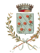
Comune di Rosate